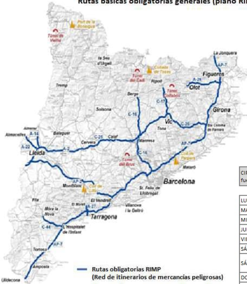
CIRCULACIÓN PERMITIDA EN EL TÚNEL DE VIELHA fuera de horarios sin equipos de emergencia en el túnel