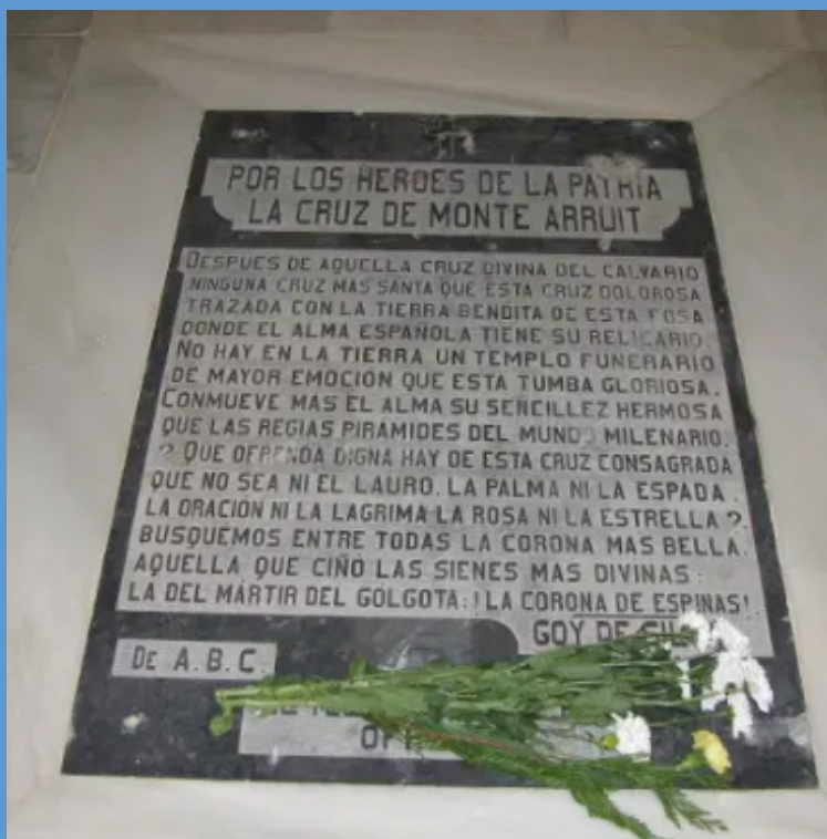
Fosa común de los héroes de Monte Arruit, cementerio de la Purísima Concepción de Melilla

En esta obra se recoge la edición facsímil del resumen del denominado Expediente Picasso , editado en 1931. Hasta 1990 fue la única publicación que permitió conocer, en parte y de manera aproximada, el proceso de investigación y de depuración de responsabilidades del conocido como Desastre de Annual . Cerca de 10.000 españoles ( las cifras exactas a día de hoy no se han podido determinar) murieron en lo que , más que una batalla, fue una salvaje matanza a manos de las cabilas rifeñas. Con ocasión del centenario del Desastre , y sin ánimo de polemizar estérilmente sobre el significado de la guerra de Marruecos, esta obra pretende ser un modesto homenaje a los españoles olvidados de aquella tragedia, que hirió y traumatizó a la sociedad española en su momento, y que condicionó nuestro devenir histórico en los años posteriores a 1921.