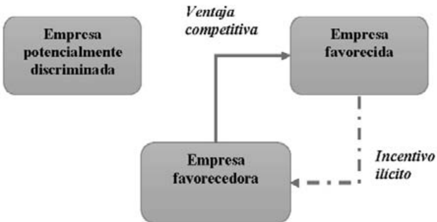
Diagrama de elaboración propia.

El «favorecimiento propio» puede ilustrarse a través del siguiente diagrama, el cual permite una mejor comprensión de la mecánica delictiva: