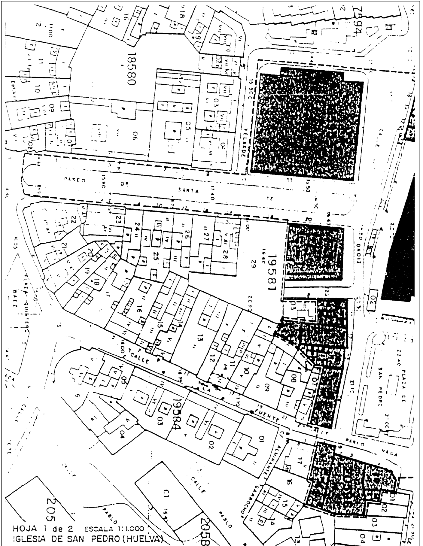
HOJA 1 de 2 ESCALA 1:1.000 IGLESIA DE SAN PEDRO (HUELVA)