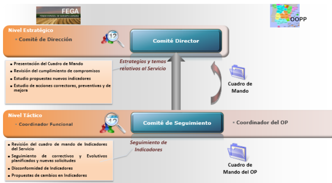
Ilustración 3. Modelo de control y seguimiento de indicadores

Comité Director periódico de control y seguimiento. Periódicamente, el FEGA internamente revisará la adecuación de los indicadores de nivel de servicio a las necesidades del OP y al volumen de actividad real, estudiando la progresión de los mismos en el tiempo. Esta revisión puede acarrear diversas acciones correctivas, tales como: reorganización de equipos, mejoras de procesos operativos de soporte, recursos humanos y modificaciones en niveles de servicio y/o en la valoración de los servicios. En estas reuniones se comprobarán las desviaciones respecto a los niveles de servicio establecidos.