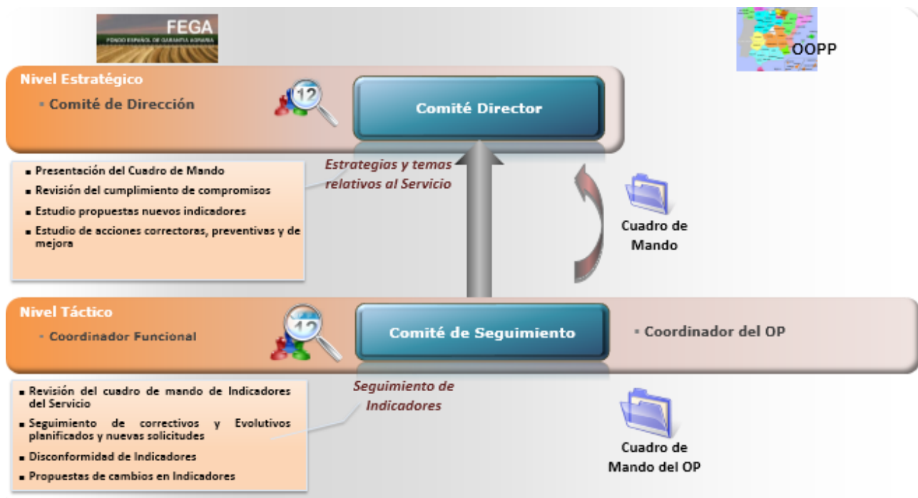
Ilustración 3. Modelo de control y seguimiento de indicadores

Comité Director periódico de control y seguimiento. Periódicamente, el FEGA internamente revisará la adecuación de los indicadores de nivel de servicio a las necesidades del OP y al volumen de actividad real, estudiando la progresión de los mismos en el tiempo. Esta revisión puede acarrear diversas acciones correctivas, tales como: reorganización de equipos, mejoras de procesos operativos de soporte, recursos humanos y modificaciones en niveles de servicio y/o en la valoración de los servicios. En estas reuniones se comprobarán las desviaciones respecto a los niveles de servicio establecidos.