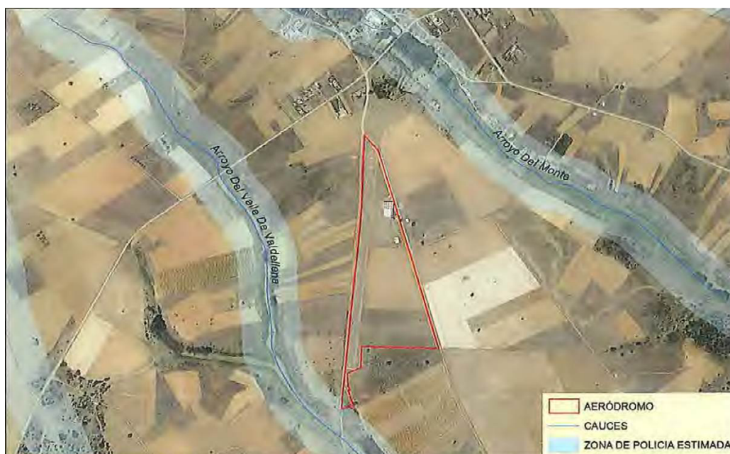
Imagen 2. Análisis espacial de la afección del proyecto sobre cauces públicos

Suelo: según el documento ambiental el aeródromo se asienta sobre suelos clasificados como clase agronómica II que se corresponde con suelos que presentan alguna restricción que minimiza la gama de cultivos posibles, o que necesitan de la puesta en práctica de medidas moderadas de conservación.