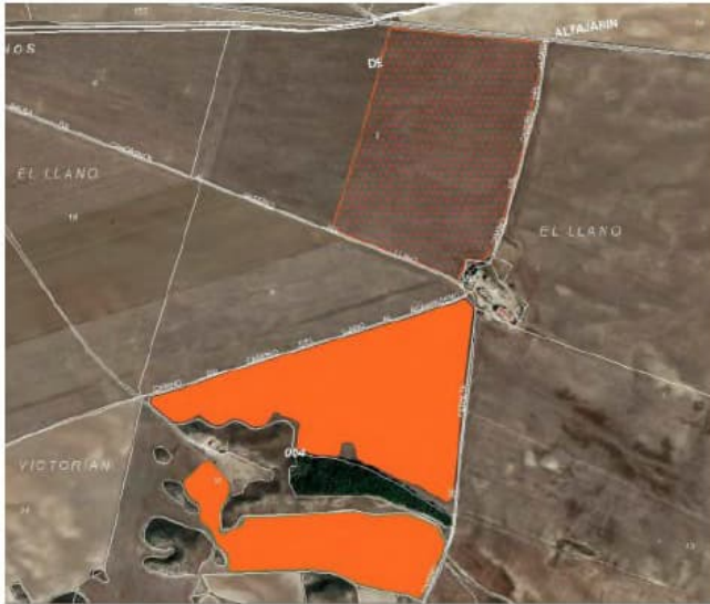
Plano tomado del informe de la DGMN (21-04-23)

funciones ecológicas del territorio, para garantizar la preservación de las especies objetivo. Finalmente, considera innecesaria la exclusión de la totalidad de la parcela 8 del polígono 4, proponiendo recuperar la posibilidad de implantar instalaciones en la parte más oriental de la parcela, como indica la siguiente imagen: