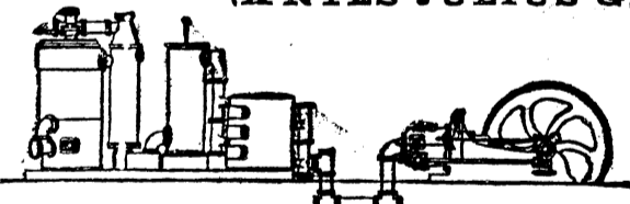
Bombas.—Calentamiento.—Material para ferrocarriles y minas.

clorosis, palidez, pobreza de sangre, desarreglos periódicos, palpitaciones nerviosas, desvanecimientos, debilidad por exceso de trabajo mental, agotamiento por pérdidas humorales, neurastenia, SE CURAN rápidamente con la